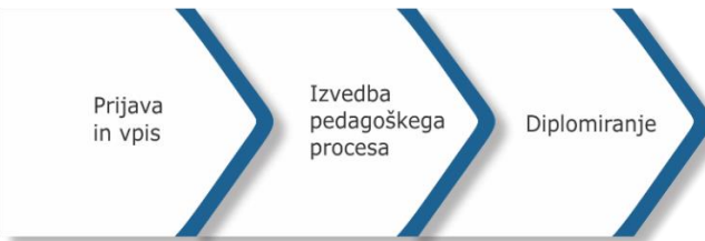
Slika 2: Procesi na področju izobraževalne dejavnosti DF

Na področju raziskovalne dejavnosti so temeljni procesi: prijavljanje, izvajanje in evalviranje raziskovalnih in razvojnih projektov, diseminacija raziskovalnih rezultatov. V vse temeljne procese na področju ZRD vključujemo študente.