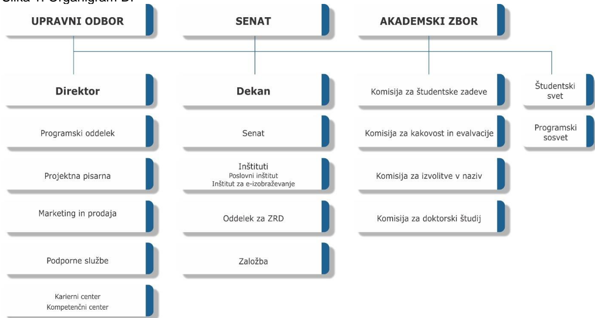
Slika 1: Organigram DF

Vodstvo fakultete skrbi za kakovostno izvajanje pedagoške in znanstvenoraziskovalne dejavnosti, za vodenje, ustrezno podporo, organizacijsko-pravne zadeve, administrativna dela, kadrovske zadeve, finančno-računovodsko delo, knjižnico in informacijsko podporo.